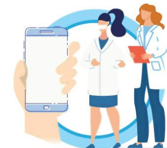
В СЛУЧАЕ ЗАБОЛЕВАНИЯ ОБРАЩАЙТЕСЬ К ВРАЧУ