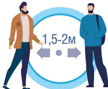
СОБЛЮДАЙТЕ РАССТОЯНИЕ И ЭТИКЕТ